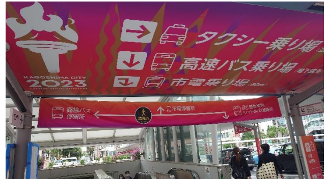
交通機関案内看板 (鹿児島中央駅)