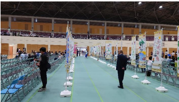
手作りのぼり旗 (始良市)