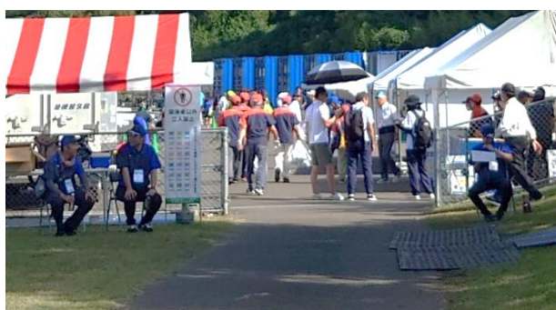
A Dカードチェック（鹿屋市）