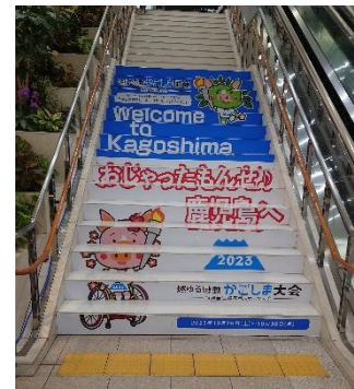
階段装飾 (鹿児島空港)