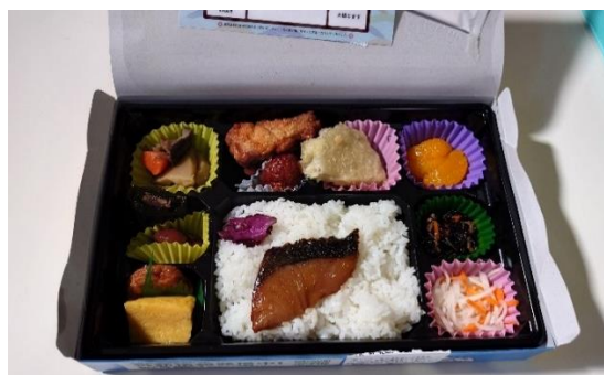
カンパチ弁当（鹿屋市）