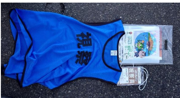
視察員用ベスト (鹿児島市)