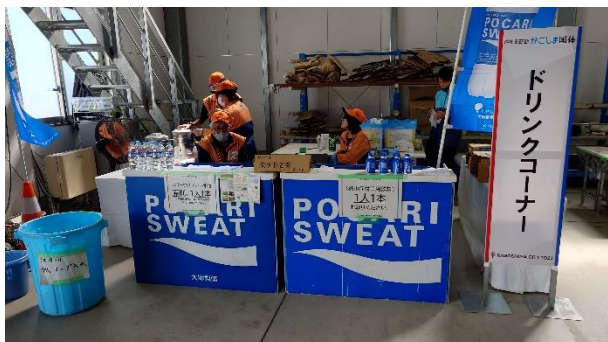
ドリンクコーナー（鹿児島市）