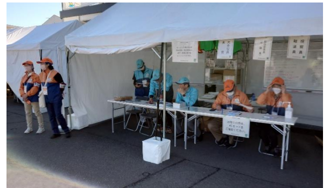
ウィンドブレーカー、帽子 (鹿児島市)