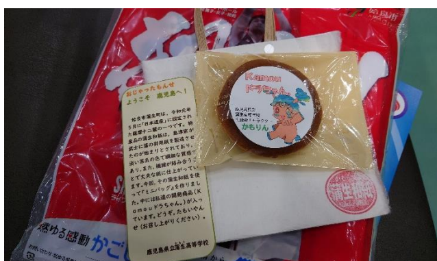
ふるまい品（どら焼き、蒲生和紙バッグ）