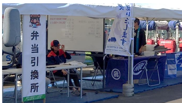
弁当引換所（鹿屋市）