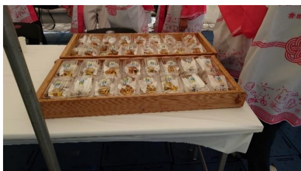
ガネ天・かるかんふるまい（鹿屋市）