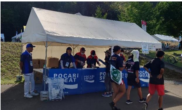
ベスト、帽子 (鹿屋市)