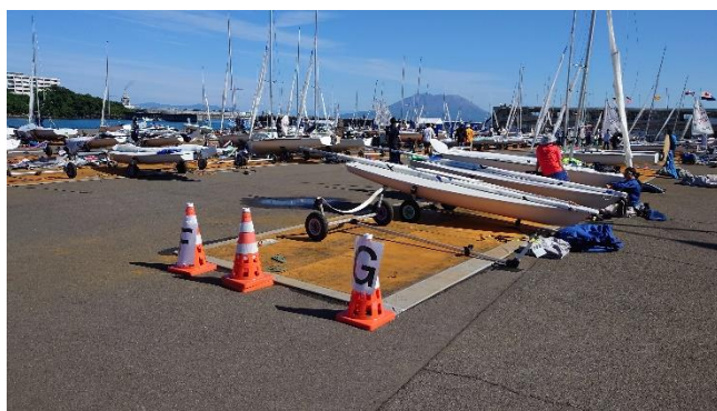
ディンギーバース（艇置場）