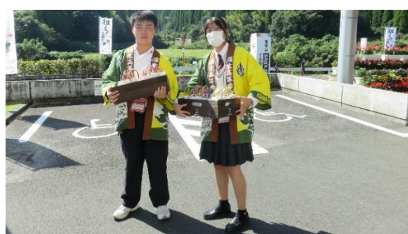
高校生によるふるまい（始良市）