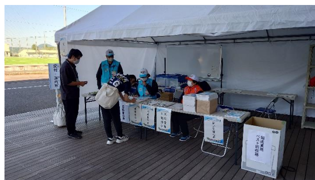
受付・案内所（関係者用）