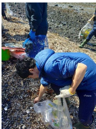
脇野沢地区 牛の首農村公園清掃活動 【4月19日(日)】

4月度は下北ジオパークの活動である大畑桜ロードや脇野沢地区の牛の首農村公園での清掃活動に参加した。様々な団体の方と協力し、自分たちの地域を綺麗にした。月の下旬では、脇野沢庁舎前で開催された「一夜限りの桜ライトアップ」に参加した。去年と比べて多くの方が参加しており、きれいにライトアップされた桜を訪れた人は楽しそうに見ていた。また、5月度から始まる自分の事業である魚料理教室のチラシ作成や公民館の確認等準備を行った。