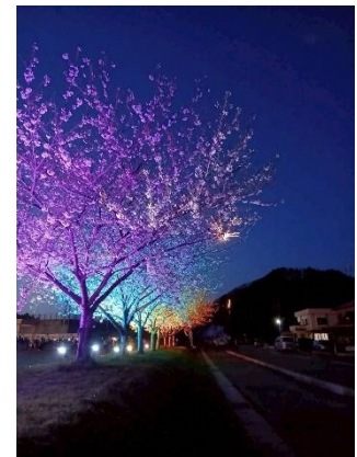
点灯後の脇野沢庁舎前の桜