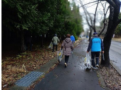
桜ロード清掃風景

桜前線の北上に合わせて、青森県下北地方の桜の名所の1つである、むつ市の「来さまい大畑桜ロード」で清掃活動に参加した。下北ジオパークサポーターの会主催で行われた清掃活動は、約200人以上の方が参加していた。自分たちは、いさりびハウス近辺の1.4kmの区間を担当した。清掃活動を通してジオパークサポーターの会の方など様々な人と交流を行うことができ、今後の活動の励みにつながった。