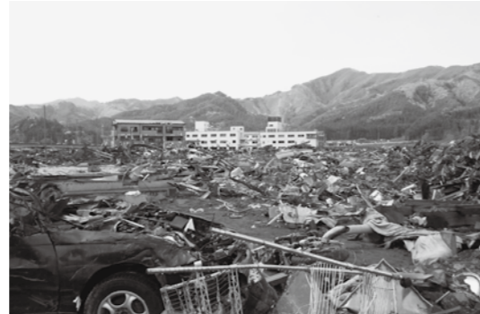
津波被害を受けた岩手県宮古市の様子 (平成23年5月8日撮影)

海岸近くでは時速約36kmとなり、普通の人々が走って逃げ切る速度ではないため、余裕を持って高台などに避難しましょう。