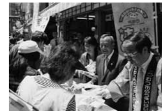
『先着プレゼント』実施 (写真は第1回の様子)