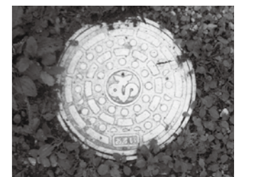
(写真)公共汚水マス