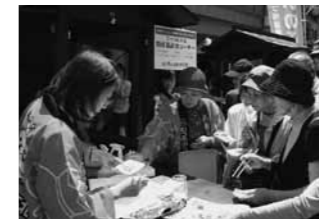
『特産品販売』実施 (写真は第1回試食コーナーの様子)