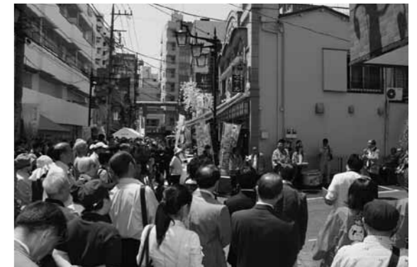
第1回オープニングセレモニー開催時の様子