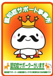
ステッカー（A5サイズ）