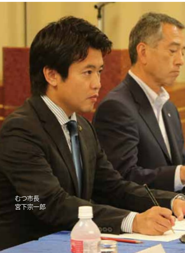
むつ市長 宮下宗一郎