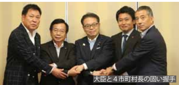
大臣と4市町村長の固い握手