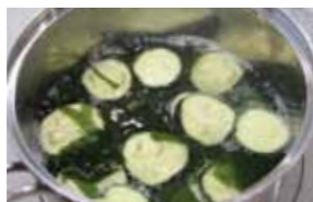
②熱湯になすを入れ、やわらかくなったらわかめを加えて火を消し、水をきる。