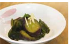
④しょうがとしその香りがさっぱり美味しい一品です。

ヘルシーバランス弁当 いかがですか？ むつ市健康づくり推進課では、カロリーの抑えめなのに大満足なお弁当のレシピを紹介しています。バランスの良い食事のために、メニューに取り入れてみてはいかがでしょうか。また、市内にヘルシーバランス弁当を製造、販売していただいているお店があります。健康づくりの一つにお役立てください。