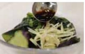
③しょうゆ、昆布だしを混ぜ、和えれば完成。