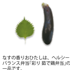
なすの香りおひたしは、ヘルシーバランス弁当「彩り 茹で鶏弁当」の一品です。