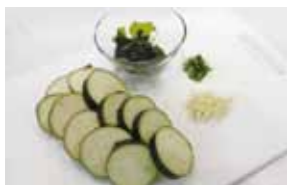
①なすは輪切り、しょうがとしそは千切り。塩蔵わかめは水で塩抜き後、食べやすい大きさに。