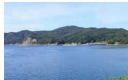
鯛島からのぞむ脇野沢の海。冬のタラ漁が有名だが、ホタテやヒラメ、ナマコ、鯛など、豊富な水産資源を誇る大切な宝だ。