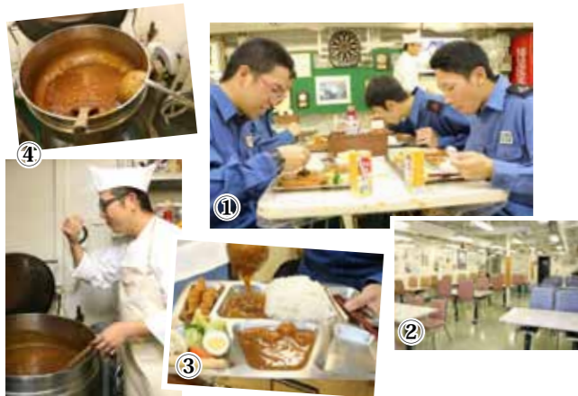
①やっぱり食事は楽しいリラックスタイム。②護衛艦ゆうだちの食堂。40席が並び、曜日くらいから「明日はカレーだ、今日はカレーだ」って考えてしまいますね。いつもたくさん盛って食べています。美味しいカレーのおかげで任務も頑張れますよ！