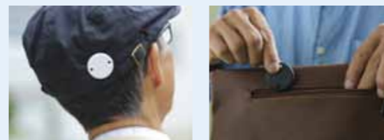
帽子やカバン、鍵など普段持ち歩くものに身につけておくことで安心です。

アプリのダウンロードやお問い合わせは 問 むつ市地域包括支援センター ☎ 22-1111 内線 2556