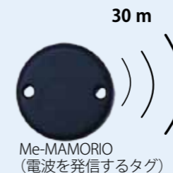
Me-MAMORIO (電波を発信するタグ)