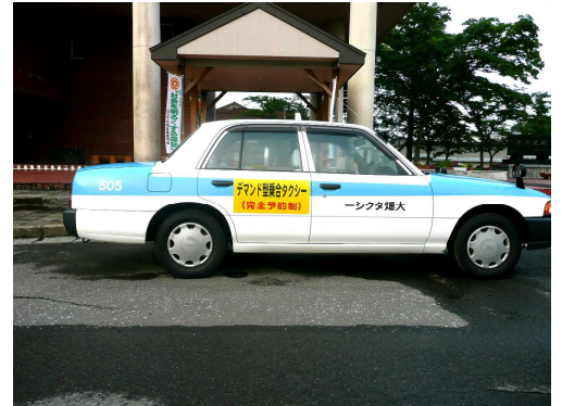
通常のタクシー車輛を使用しています。