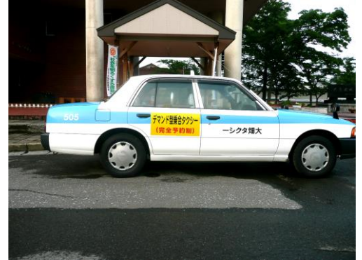
通常のタクシー車輛を使用しています。

「デマンド型乗合タクシー」とは予約があった時だけ、バスのように乗合で運行するタクシーです。お気軽にご利用ください。