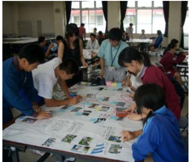
あそこは何色にしようかな～。