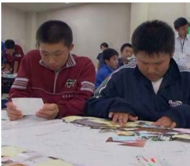
たくさん撮ってきたので、分類作業が大変です。