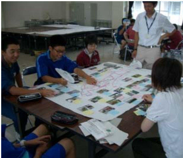
ここはやっぱりはずせないな～。