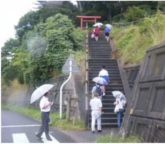
愛宕山へもどろんどろん登ります。