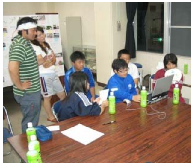
ナレーションを入れ、明日の成果発表会に備えてリハーサル中です。