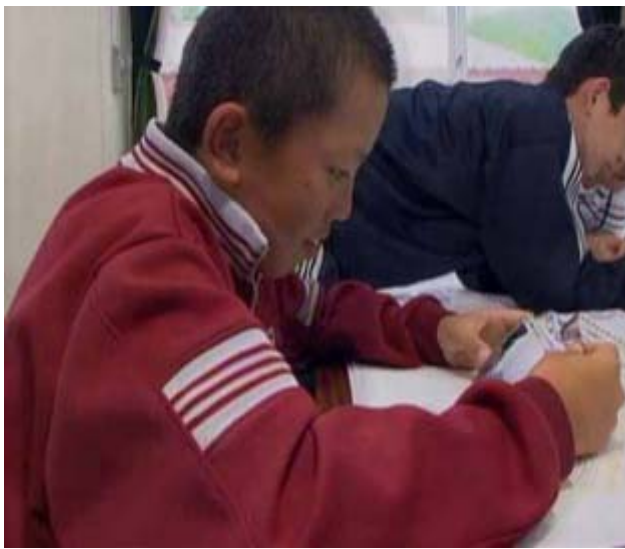
午後は、撮ってきた写真を分類して、それぞれコメントを付けていきます。これはどこを撮ったんだっけ？