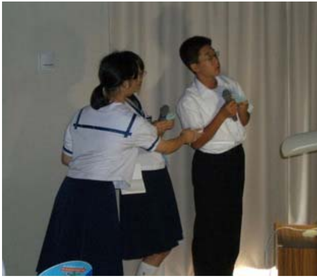
Gグループの発表です。タイトルは、「5人の旅 in 脇野沢」です。