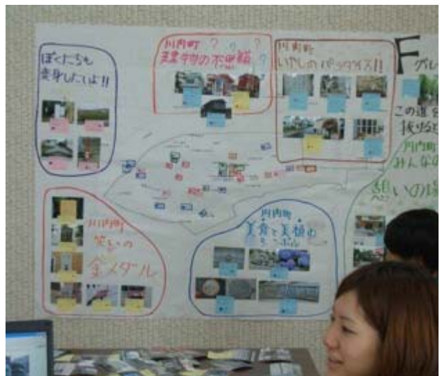
写真をグルーピングして、分かりやすいマップになりました。