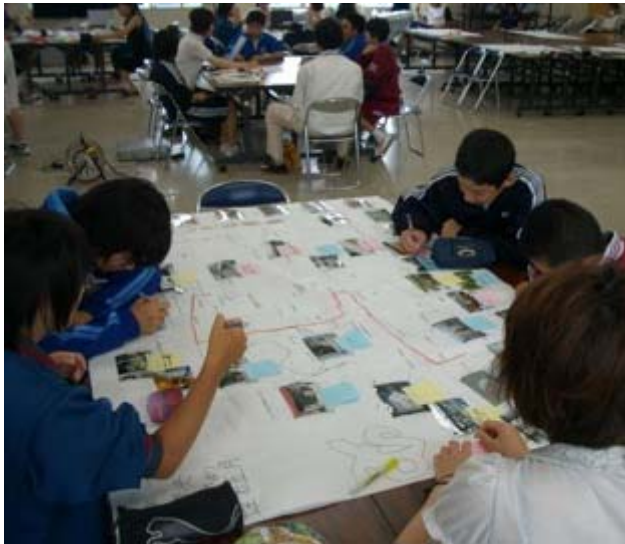
午前中は、2日目に撮ってきた写真を地図に貼り、「まちの資源マップ」を作りました。