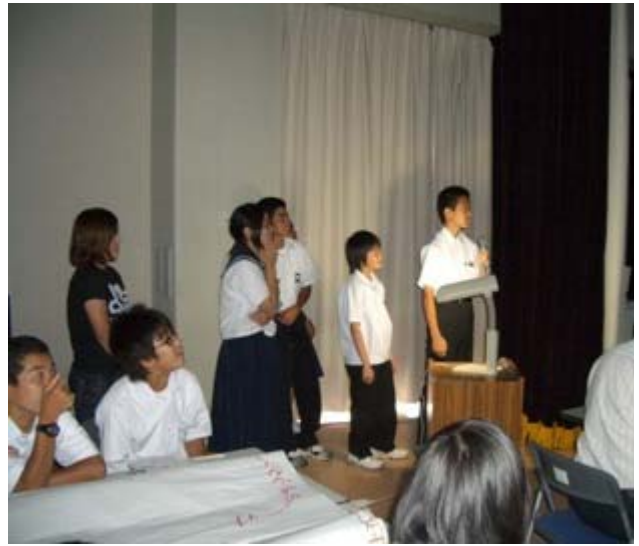
最後にHグループの発表です。タイトルは、「Wakinosawa in green park」です。