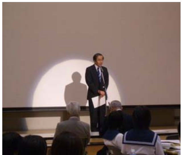
宮下むつ市長より、講評をいただきました