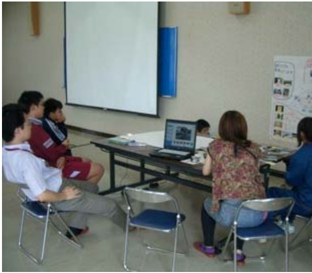
午後は、まちの資源マップを見ながら「まち歩き探検物語」スライドショーを作りました。