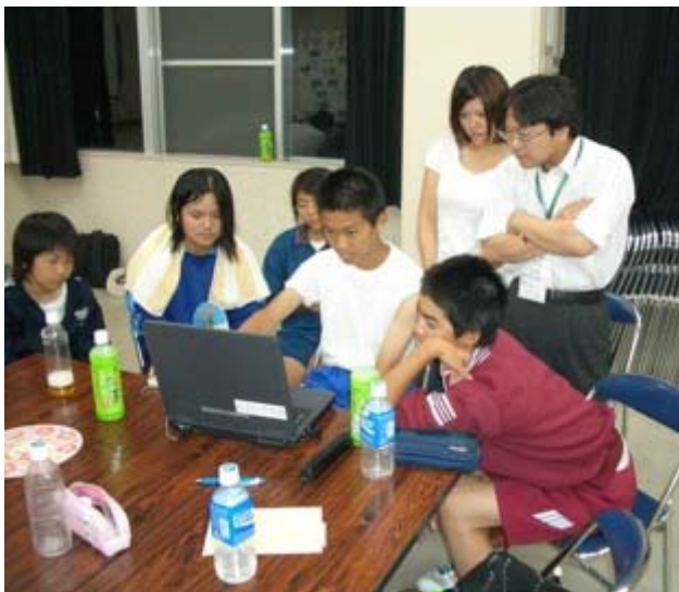
パソコンの操作にも大分慣れてきました。