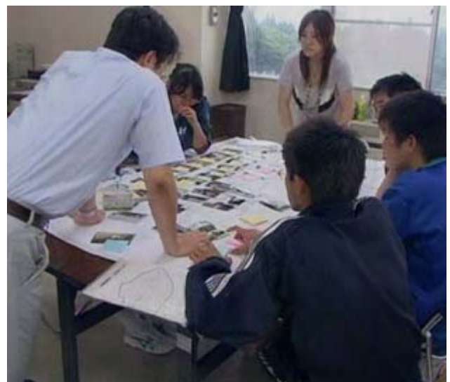
明日の作業に備え、写真を並べてまちの資源マップの構成を検討中。