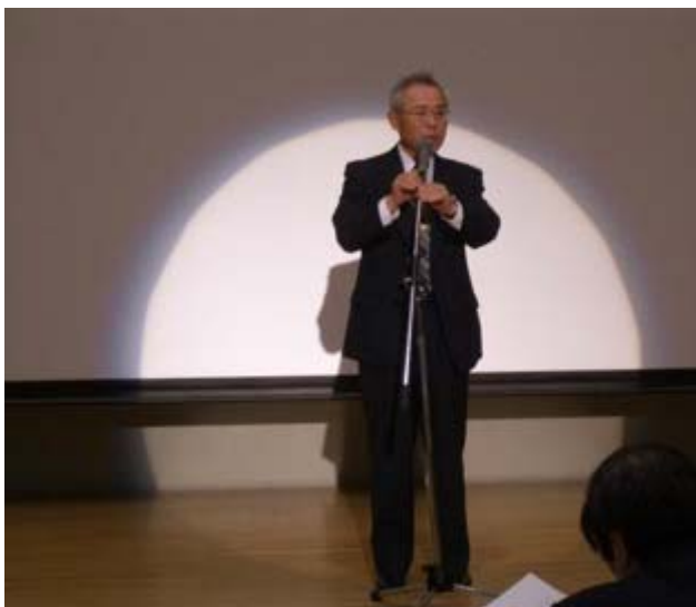
牧野むつ市教育長より講評をいただきました。