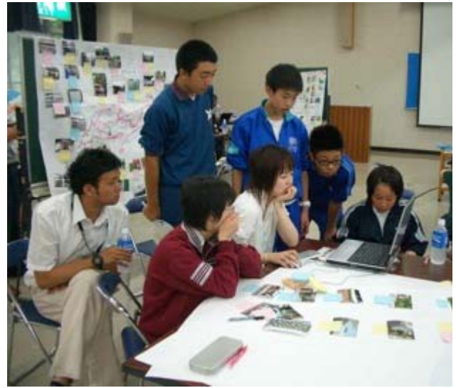
ストーリーも決まり、いよいよスライドショーの制作開始！