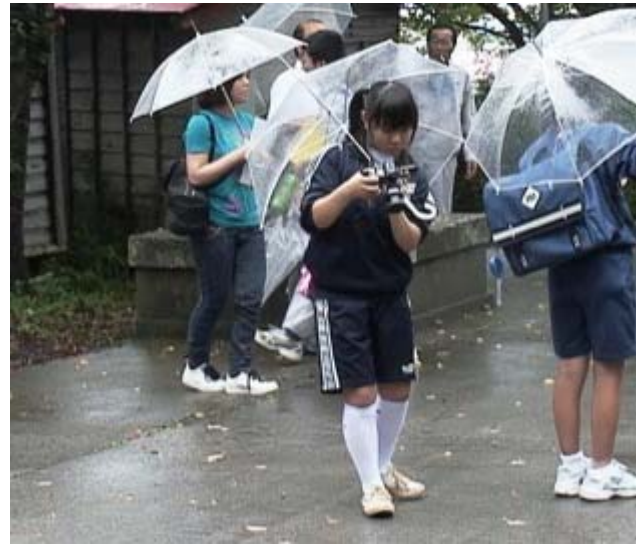
撮った写真を最終チェック。