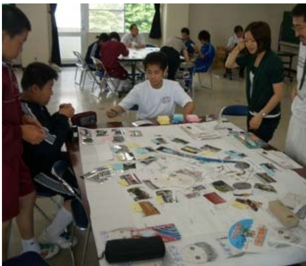
大分マップらしくなってきました。