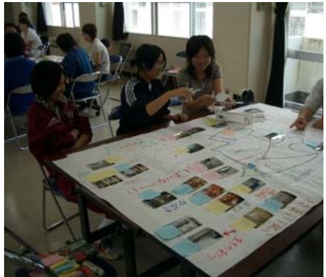
この写真も貼ろうか？