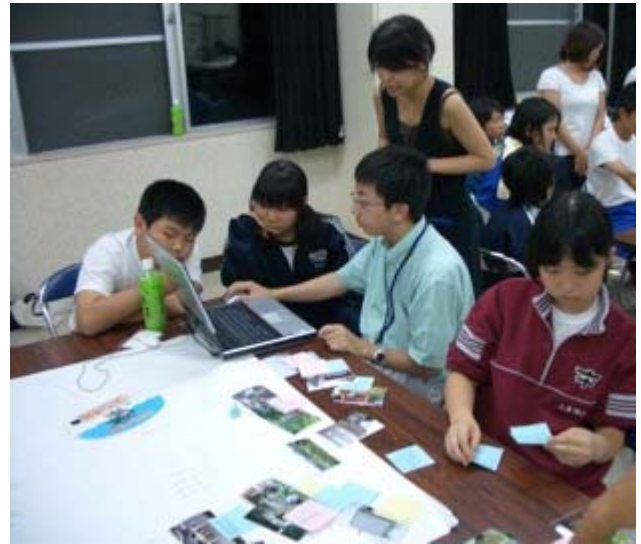
このスライドは、こういう感じにして・・・。