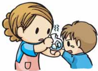
刺された所を冷やす