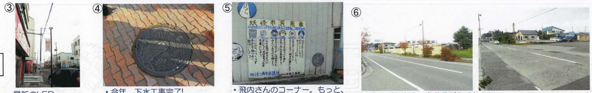
③ 最新のLED街路灯。今年七月完成。 ④ 今年、下水工事完了! ⑤ 飛内さんのコーナー。もっと、広い場所での展示。中野さんとコラボ。 ⑥ バイパス完成で交通量が多くなった。