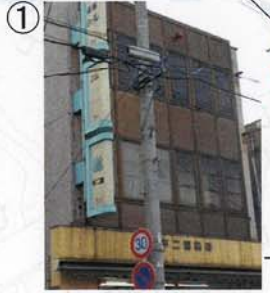
① 警察? ② 保楽映画館の解体により、下北交通の裏側を含めて新たな親水緑地公園を作れる可能性が出てきた。