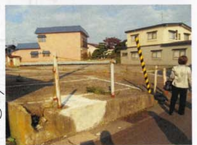
• 空き地が多くなっている。活用されていない。