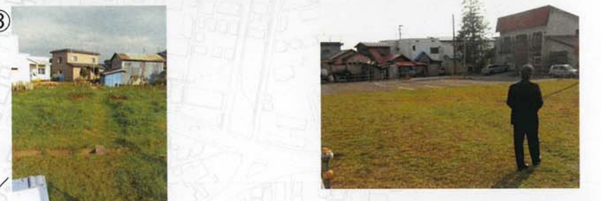
⑦ ⑧ けものみち。