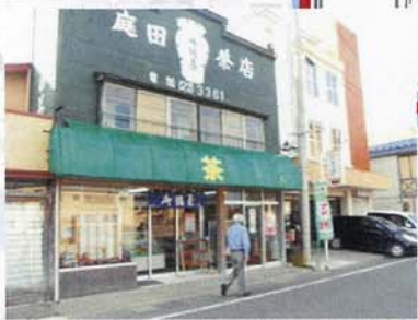
• 個性的なお店がたくさんある。