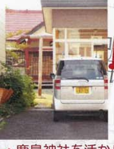
⑬ 鹿島神社を活かし切っていない。