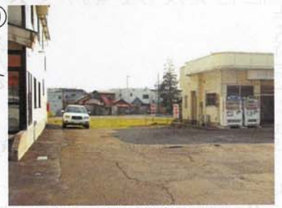
• 空き地の活用を考えたい。