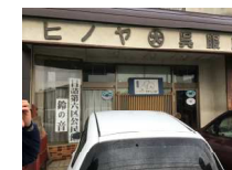
空き家リノベーションイメージ