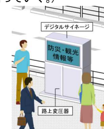
設置イメージ 国土交通省資料より