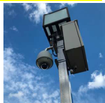
防犯カメラの設置