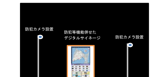
暗い夜道でも安全なまちづくりの推進