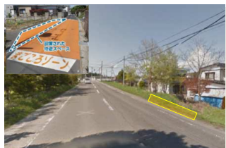
歩行者待避ゾーンの設置