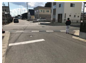
角地での隅切り工事