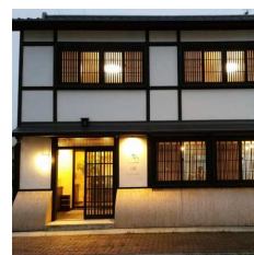
むつ市でのリノベーション事例 アツギ shop&café 都市再生推進法人田名部まちづくり会社 空き店舗を改修しカフェとアツギ東北株式 会社のアンテナショップとして活用

民間まちづくりの推進や、エリア価値の向上につながるスピード感を持った事業を展開するため、支障になる都市環境の改善整備（公共施設の改良等）や空き家・空き地のリノベーション事業へ協力します。