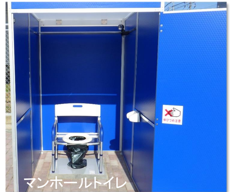
マンホールトイレ