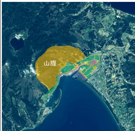
釜臥山の頂上から用途地域までを山腹とし、設置がふさわしくないエリアとします。

そこでむつ市では、釜臥山の雄大な景色の保全と、ジオパーク周辺、そして観光で使われる国道や下北半島縦貫道路、大湊線からの景観保全のために、本アクションプランを作成し、太陽光発電設置と景観の保全に関するむつ市の方針を定めることとします。