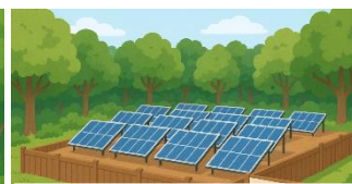
太陽光発電施設が見える高さの塀は景観に配慮したものではありません。