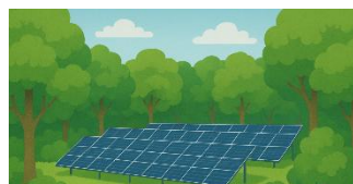
直接見えないように景観に配慮した塀を設置する必要があります。

沿道景観形成区域及び観光景観保全区域に太陽光発電施設を設置する場合は車窓から直接見えないように景観に調和したデザインの塀を設置するか既存の樹木を活用するなど配慮する必要があります。