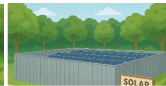
景観と調和しない色彩やデザインの塀は景観に配慮したものではありません。