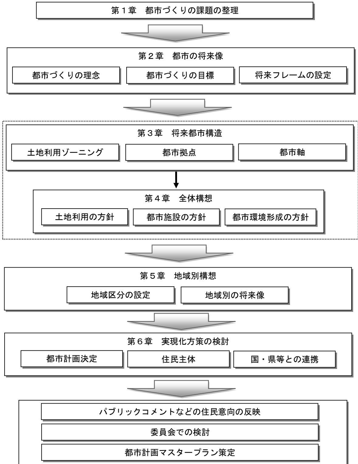
図 策定フローチャート