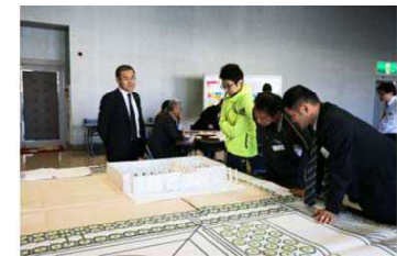
1/100の模型を用いて、お祭りなどの多目的な使い方を検討しました。

今回の第1回のワークショップではA・B・Cの3つのグループに分かれ、図面と模型を用いながら意見交換を行って頂きました。機能の側面だけに留まらず、日常的な体育館の使い方をイメージしながら検討を行うことができました。最後はグループ毎の意見を共有し、全体のまとめを行いました。