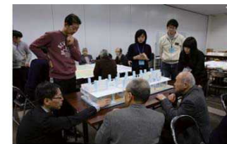
1/50の模型を用いて、オープンスペースの使い方を検討しました。

今回の第3回のワークショップではA・B・Cの3つのグループに分かれ、図面と模型を用いながら意見交換を行って頂きました。選手や市民の方が交流するラウンジを中心に、日常的な体育館の使い方や大会時などの様々な状況をイメージしながら検討を行うことができました。ワークショップの最後には各グループから出てきた意見をファシリテーターが整理し、発表しました。