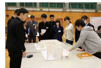
1/100の模型を用いて、お祭りなどの多目的な使い方を検討しました。

今回の第2回のワークショップでは、A・B・Cの3つのグループに分かれ、新体育館の図面を見たり、テーブルやイス等の家具模型を実際の模型に配置したりしながら、新体育館に求める機能や日常的な体育館の使い方を検討し、3年後の完成を目指す体育館のイメージを掴みました。また、ワークショップ後半には、各グループの学生代表が仙台高専のファシリテーターと一緒に、自分たちのグループの意見を発表しました。