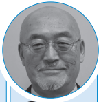
○ 陸奥未来 ○ 岡崎健吾

この度の選挙で、6期目当選を果たしました浅利竹二郎です。人口減少高齢化が進む社会では元気なお年寄りの存在が貴重です。宮下県知事44歳、山本むつ市長40歳、この若い力と高齢世代が力を合わせ、青森・むつ新時代を築こうではありませんか！私はこれまで皆様の期待に応えるべく、誠心誠意努めてきました。今後とも頑張ります。