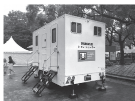
トイレトレーは能登半島地震でも大いに活躍している

問 災害におけるトイレ問題をもっと真剣に考えていくべき時である。本市としてもトイレトレーの導入をすべきではないか。 答 導入については、緊急防災・減災事業債などの、非常に有利な地方債がございまして、そういったところも含めて導入にむけて検討を進めてまいります。 問 障がい者の方々の心理負担の軽減や、社会参加の更なる充実のために障害者手帳アプリ「ミライロード」の導入