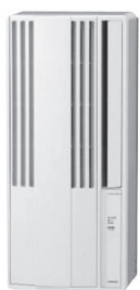
スポットクーラー (窓枠設置タイプ)

答 キュービクルの改造は不要で取り付け可能な電気量のものを選定しており、冷房能力はエアコンより劣るが、既存の扇風機も併用して使用することも可能である。