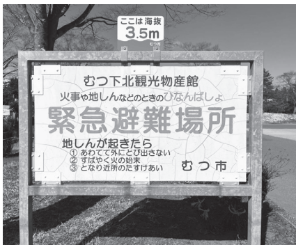
現在、設置されている緊急避難場所表示看板

「予算議会」ともいわれる3月議会。令和6年度予算の審査は、3月7日・8日・11日の3日間。延べ約10時間に及ぶ議論から、主なものをピックアップしてお知らせします。