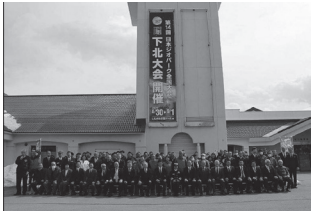
日本ジオパーク全国大会 下北大会懸垂幕お披露目

問 日本ジオパーク全国大会下北大会はどれくらい規模になるのか。 答 会場全体の来場者は、8月31日と9月1日の2日間で延べ1万8000人、宿泊を伴う地域外からの来訪者は1日、800人と見込み、開催するステージ発表やポスター発表及び見学者を含め1000人を超える児童・生徒の参加を予定している。大会ボランティアとして約100名の生徒が参加予定となっている。