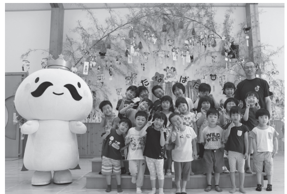
令和5年7月6日「むつ市こどもまんなか宣言」を行った並木保育園の園児達

答 定期的に情報を共有して、こどもの権利に関する侵害や救済について必要な助言を受ける。