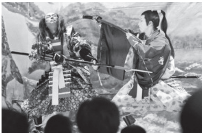
📷 画像上：奥内歌舞伎新春公演的一幕 画像下：活気ある大湊ネブタでの一場面

ねぶたやお祭り、歌舞伎などの伝統芸能は観る人を楽しませるが、担い手不足が深刻だ。