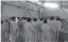
新規高卒者市内定着支援事業 (むつ市優良企業見学会)

問 地元企業を育成するには、市内に本社がある事業者に対し、公共発注の受注機会を増やす対策が必要ではないか。 答 地域経済の持続的な発展のためには、市内の事業者が、これまで担えなかった分野で受注できる体制や環境が必要であるとの認識のもと、課題を明確にし、