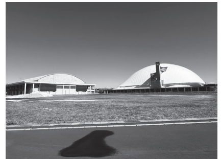
令和8年開催のあもり国スポ・障スポではマエダアリーナが会場となる。むつ市ではローイング・バスケットボール(成年女子)・セーリング・フェンシングなどの競技が行われる予定だ。

問 今回整備する艇置き場はどのように考えているか。 答 駐車場と同様の舗装を行うため、大会終了後は、むつマエダアリーナの駐車場として活用する。