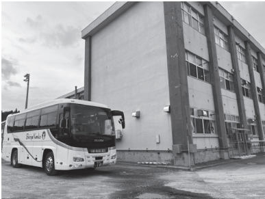
保護者の負担となっていたバスでの通学費も新年度からは半額補助されることとなる。

答 定期券利用者については、定期券の期間が終了した後、必要書類を市に申請し、後日振込となる。また、スクールバス利用者については、保護者とバス事業者の契約により運行されているため、市から直接バス事業者へ補助金が支払われる。そのため、保護者がバス事業者に支払う額は、補助額を差し引いた金額となる。