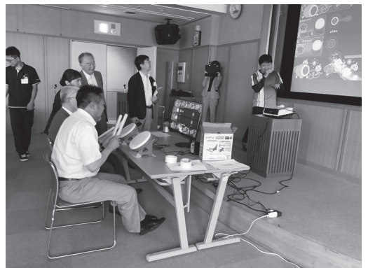
☑ eスポーツを活用した介護予防事業については、令和5年度において民生福祉常任委員会が先進地視察を行っている。画像はその際の現地視察での体験のようす。

埼玉県鶴ヶ島市において、eスポーツに取り組みることによる認知機能への効果検証をされており、情報処理速度の改善・短縮に対して、有効であったと結論付けていることから、当局としても認知症予防の観点でeスポーツに取り組み、事業を展開していきたいと考えている。