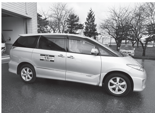
📷 現在、市の直営運行に使用されている車両。令和5年度は試験的に予約（デマンド）型のタクシーが運行されていたが、今年度から本格的に運行が実施されている。

答 1000円を上限にタクシー料金の4分の1の額を基準とする。交通事故があった場合は、市で加入している自動車保険によって対応する。令和6年度以降は月曜日が委託（タクシー事業者）による運行、火曜日から金曜日までが市の直営運行となる。