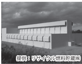
リサイクル燃料備蓄センターを外観から

問 中間貯蔵施設を何のために誘致するのか。 答 立地受け入れという形で、国策へ協力することを通じて地域振興の推進を図ることを目的としている。 問 キャスクが搬入されるまでの手順はどうなるか。 答 柏崎刈羽発電所における使用済燃料の搬出計画を受け、策定される貯蔵計画をもとに、安全協定締結に向けたプロセスが進み、1基目のキャスク搬入、最終使用前事業者検査を経て、事業開始に進む。