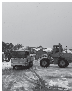
今冬の数少ない除雪作業

問 雪が多くても出ない、少なくとも出る。除雪の出動基準であるの。 答 概ね降雪量10cm以上であって、積雪状況、気象情報等で雪が降り続けると予想される場合や、地吹雪等で交通に支障を及ぼすと判断される場合は出動するものとするが、交通量の少ない路線では、日中の気温上昇が見込まれる場合などは、出動基準以上の降雪量であっても、出動を見送るなど、状況に応じた効率的な除雪に努めている。