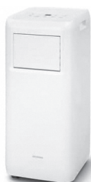
スポットクーラー (床置きタイプ)