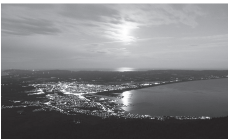
☑ 釜臥山展望台から夜にむつ市内を望むと、アゲハチヨウが浮かび上がる夜景を見ることが出来る。

夜景という特性を生かして、国内外から着地型と言われる宿泊を伴う誘客の増加を目指すとともに、市民の皆様にも、地域に対する愛着や誇りを醸成し、日々の明かりを灯してもらうことで、むつ市のアゲハチヨウの価値を高めていく。