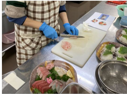
【説明を受けて、海産物を刺身に加工する参加者らの様子】