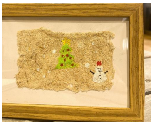
【試作した紙に書いた絵】

1月の体験館祭り内でモニターを兼ねて行う予定の紙漉き体験の準備を進めていた。写真立てに入れた際のサイズの調整や、企画内の詳細な流れを調整している。体験館祭りでの参加者にアンケートをして頂き、それを参考に今後の開催の際の参考にする。