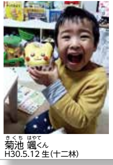
きくち はやて 菊池 颯くん H30.5.12 生(十二林)