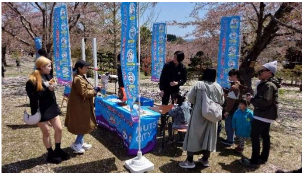
むつ桜まつりPRブース