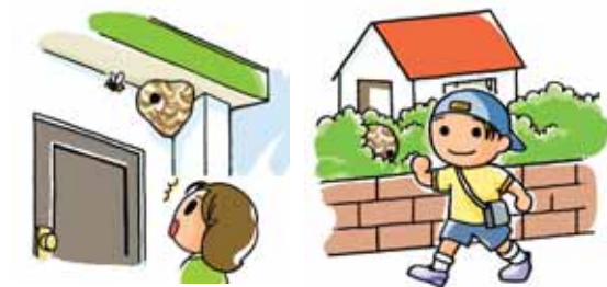
玄関などの出入り口付近