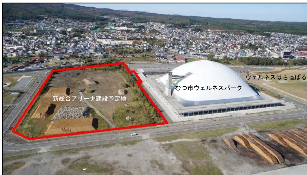
新総合アリーナ建設予定地周辺 現況写真