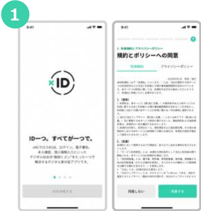
「xID」アプリをダウンロードしてアプリを開きます。規約とポリシーの確認をします。