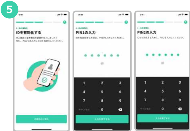
IDを有効化するために、PIN 1とPIN 2を再度入力します。