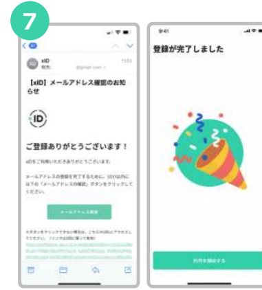
確認用メールに記載されているURLをタップした後、“利用を開始する”をタップします。