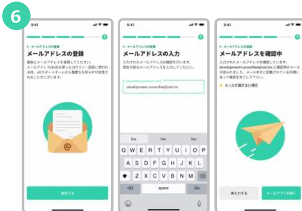
xIDからのメールを受信できるメールアドレスを入力します。