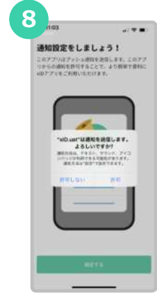
xIDをプッシュ通知でお知らせするために“許可”を選択します。