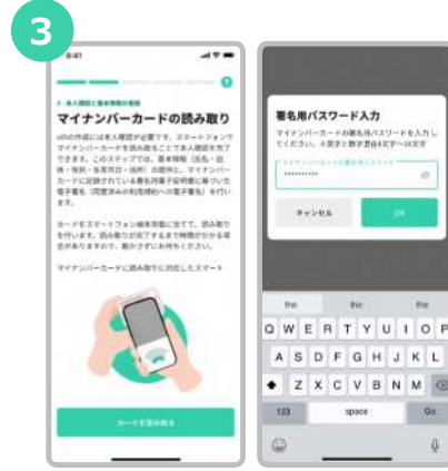
マイナンバーカード受取り時に設定した署名用電子証明書の暗証番号を入力します。 (英字大文字と数字混在の6~16桁)