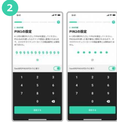
xIDアプリのログインや認証で使うPIN 1、電子署名で使うPIN 2を設定します。