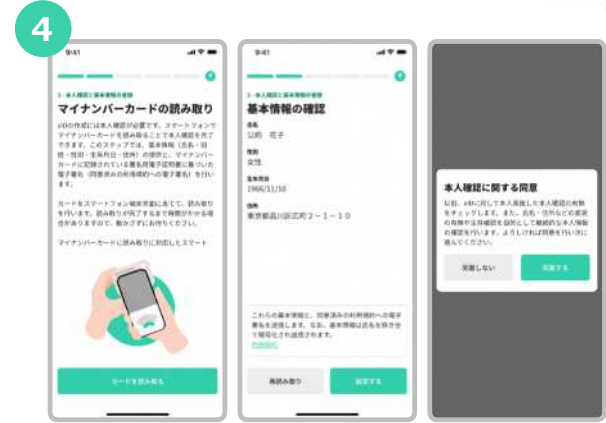
“カードを読み取る”をタップし、スマートフォンでマイナンバーカードの読み取りをします。読み取った情報を確認します。