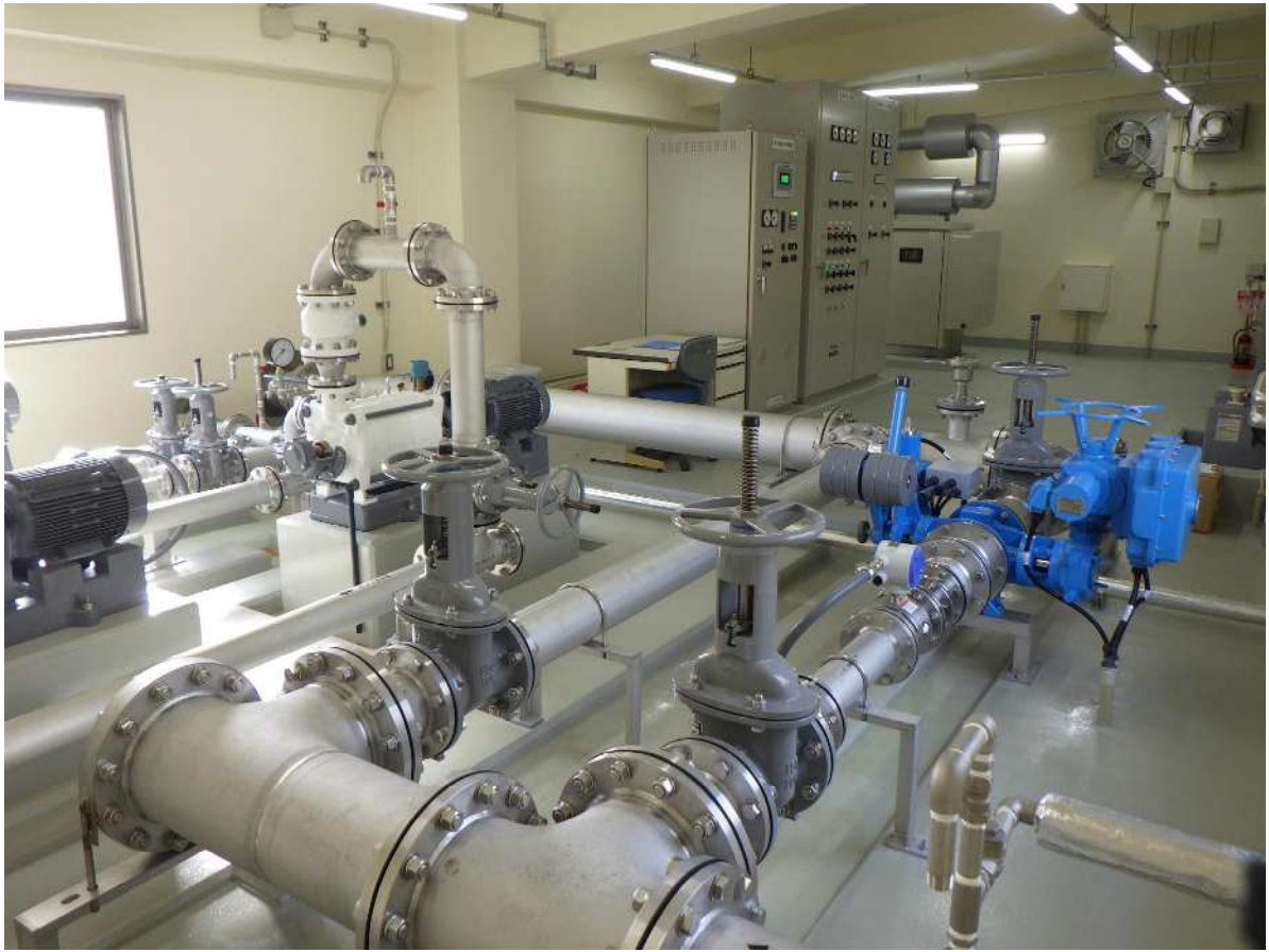
脇野沢ポンプ場内の送水設備