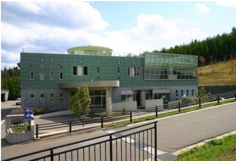
上水道管理センターの全景