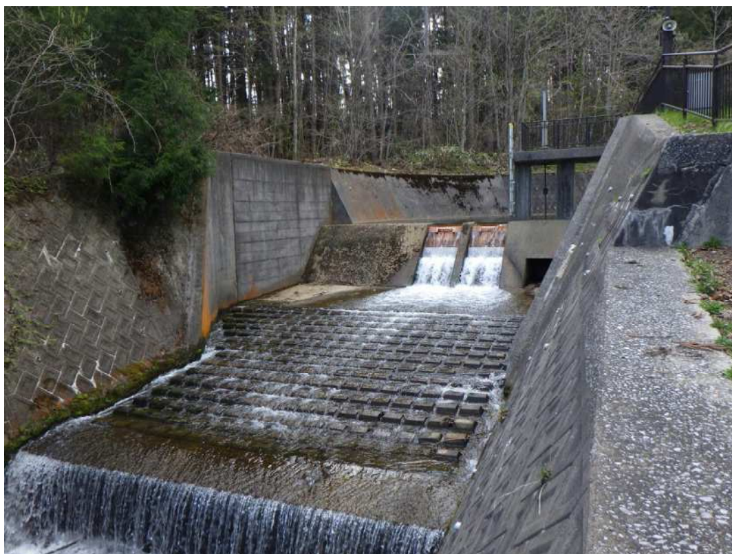
宇曽利川浄水場の取水施設