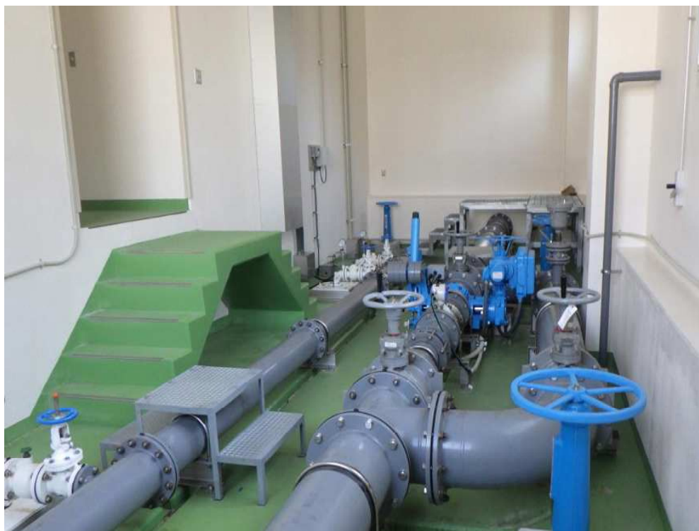
八木沢浄水場内の送水設備